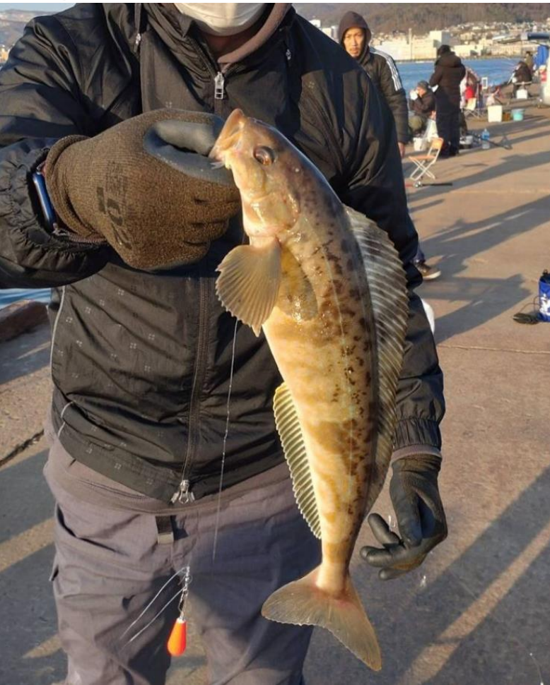
jacky._0038 (タイトル) 北海道はホッケでかい! (コメント) 釣りはするけど食べれない #北海道臨床工学技士会 #haceフォトコン2024