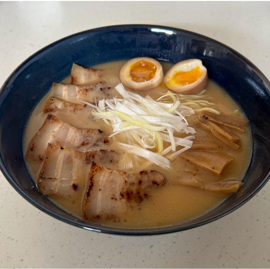
haru80500 自作ラーメン 豚骨と鶏ガラを2日間煮込んで作ったスープで自分好みの味付けに出来ました★★★★★5.0 #北海道臨床工学技士会 #haceフォトコン2024