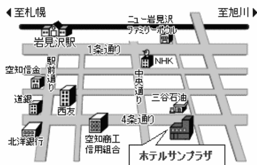
専用駐車場案内図