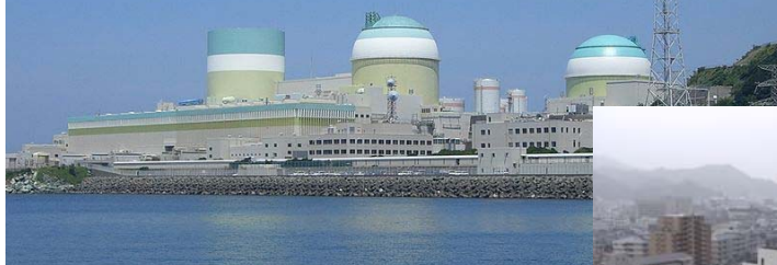
伊方原子力発電所