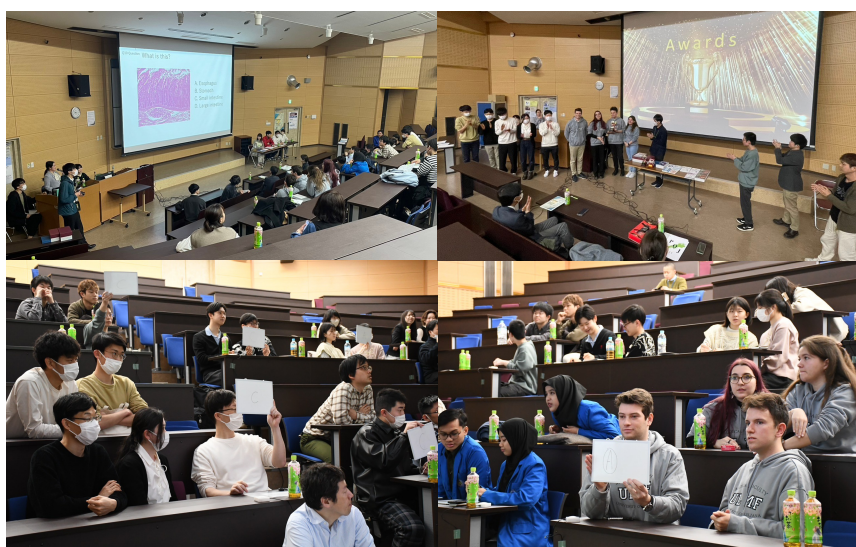
前大会(PQJ2024)大会中の様子