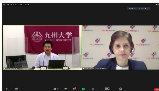
【大隈医師 Q&A セッション】