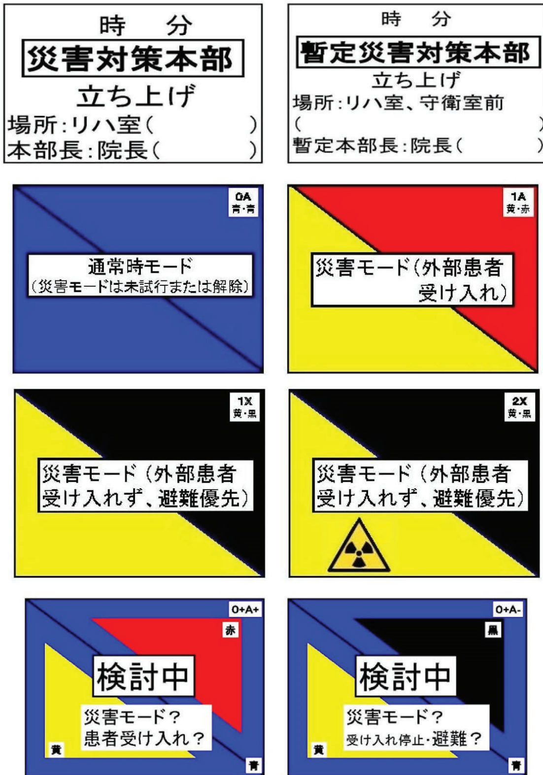
別表8 災害下における病院状況を表すカラーコード