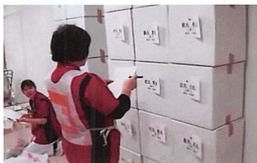
写真2 患者私物用容器 搬送する患者私物は医療廃棄物容器(40L)1箱に制限した。災害医療計画に基づき、小児以外では家族の同行は許可しなかった。