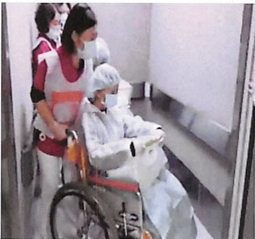
写真5 護送患者の搬送風景

護送患者は手術キャップとマスク、簡易雨合羽を着用し、車イスで病院出口へ向かった。