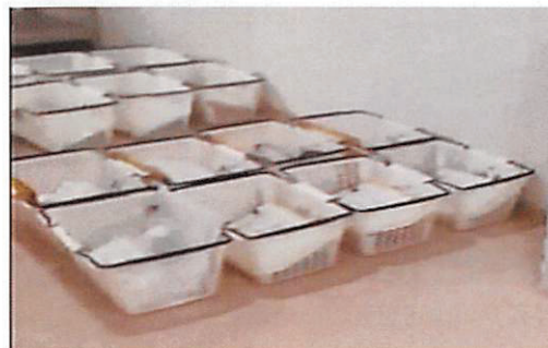
写真3. 患者情報患者情報ファイル(上)と薬剤搬送用の籠(下)

患者情報患者情報ファイルを注射薬・内服薬(安定ヨウ素剤を含む)とともに籠に入れ、患者ごとに整理した。