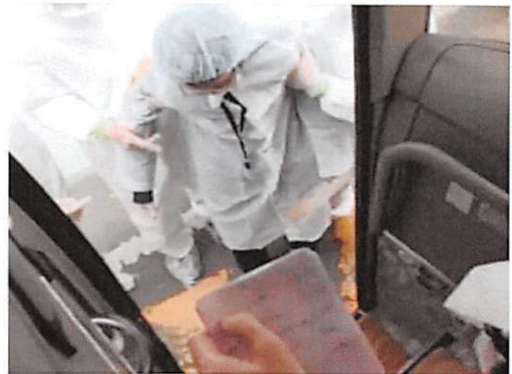
写真7 護送患者のマイクロバスへの乗り込み

護送患者は手術キャップとマスク、簡易雨合羽を着用し、車イスで病院出口へ向かった。