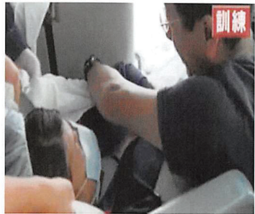
写真6 大型バスへ担送患者を搬入