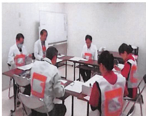
写真1 当院原子力防災災害対策会議(模擬) 発災2日目、午前8時30分。院長、副院長、救急部長、事務局長、看護部長、放射線科医長などが出席。

自由意見として、バスの階段が高く通路は狭いので担送患者の搬入は困難、護送患者がバスに乗り込むためにステップなどが必要(表3)、防護衣の脱衣手順が不徹底、安定ヨウ素剤(模擬)が配布されたのに県から服用指示が出なかったのはなぜか、などの意見があった。