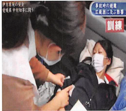
写真8 大型バス内の光景

左) 看護師1人が2人の患者の観察・処置を担当。右) 長時間搬送を念頭に点滴を再開した。