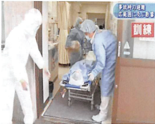
写真4 担送患者の搬送風景

担送患者は手術キャップとマスクを着用し、全身を手術シートで覆った。院内搬送要員は手術着、院外搬送要員はタイベックスーツ着用とした。