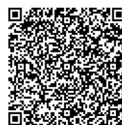
6/6 北海道/札幌 ※応用編のみ