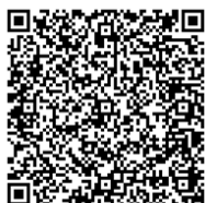
6/6 北海道/札幌 基礎・応用編