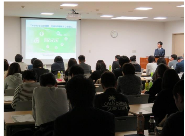
手術室安全セミナーの様子