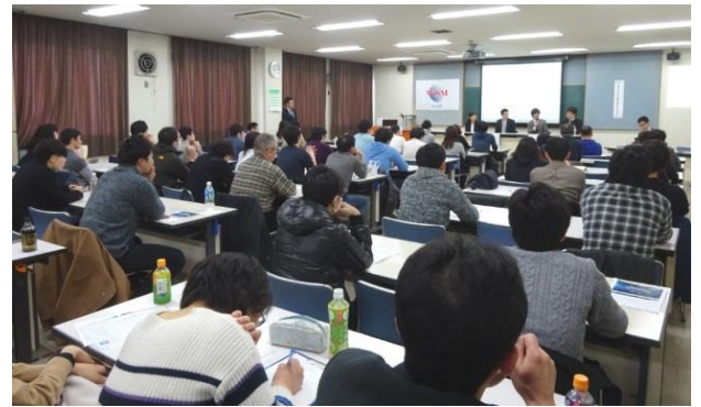
第15回卒後教育セミナー 会場風景

セミナーのテーマは、「今一度、基本に戻ろう！デバイス関連業務」となっており、会場には多数の会員が足を運び、座席を確保することが困難なくらい大盛況なセミナーとなっております。